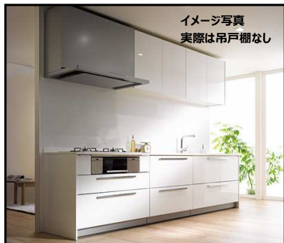
イメージ写真 実際は吊戸棚なし

キッチン・洗面台を新品交換 全面クロス張替え・全室フローリング トイレ2箇所 新品ウォシュレット付です LDK15帖 収納たっぷり 床下収納 モニタ付インターホン 全室照明器具付き